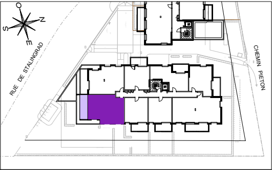
HALL A Appartement de 3 pièces n° A36 au 3ème étage